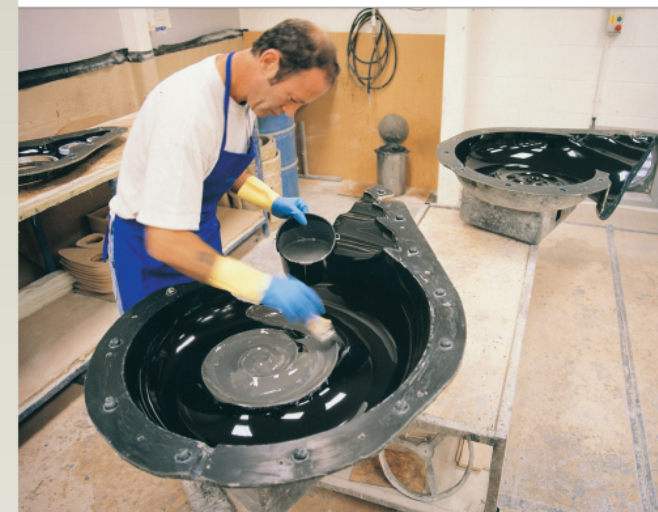
Fabricação de caixas high-end: cuidado artesanal com cada componente utilizado.

Hoje, a música que a maioria ouve não está mais gravada em disco ou fita - está "na nuvem", em arquivos digitais armazenados em servidores que ninguém sabe onde ficam, mas aos quais se tem acesso com dois ou três cliques. Para apreciar todo o potencial desses arquivos, basta procurar nos lugares certos. E, claro, montar um equipamento de áudio que seja... isso mesmo: high-end. De preferência, high-end.