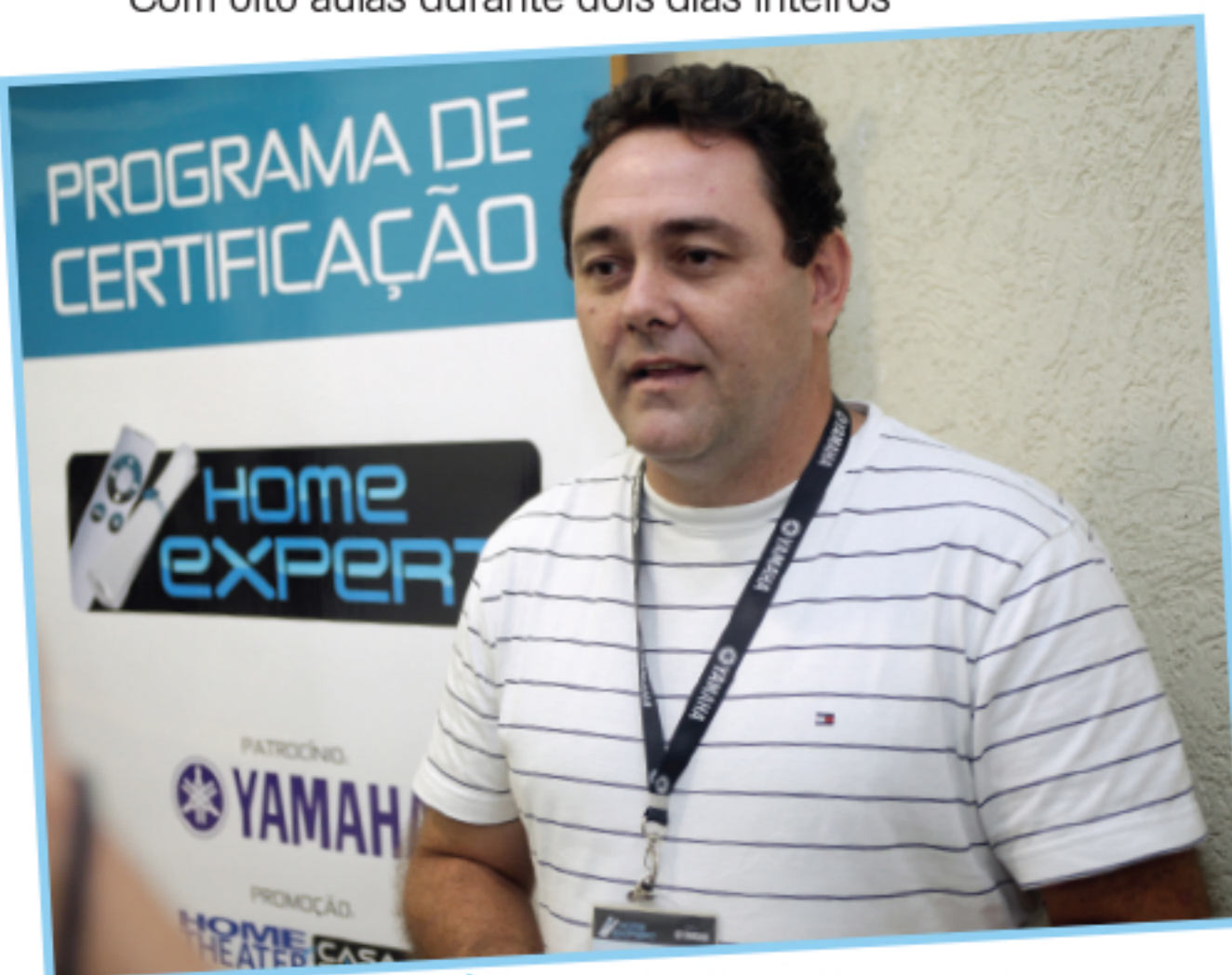
► Birnfeld, de Uberlândia: instrutores vivenciam a realidade.

Empresas tradicionais do segmento - como as lojas paulistanas Antares e Imagic e a operadora de TV por assinatura Sky - decidiram inscrever funcionários para participar do Programa, visando se diferenciar da concorrência. "Com os equipamentos se tornando cada vez