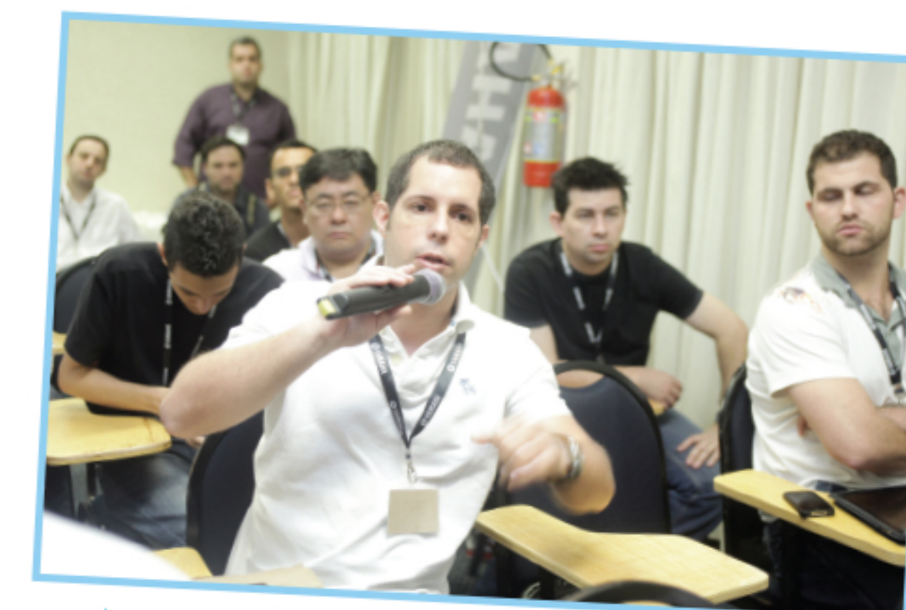
▲ Os participantes puderam fazer perguntas aos instrutores ►