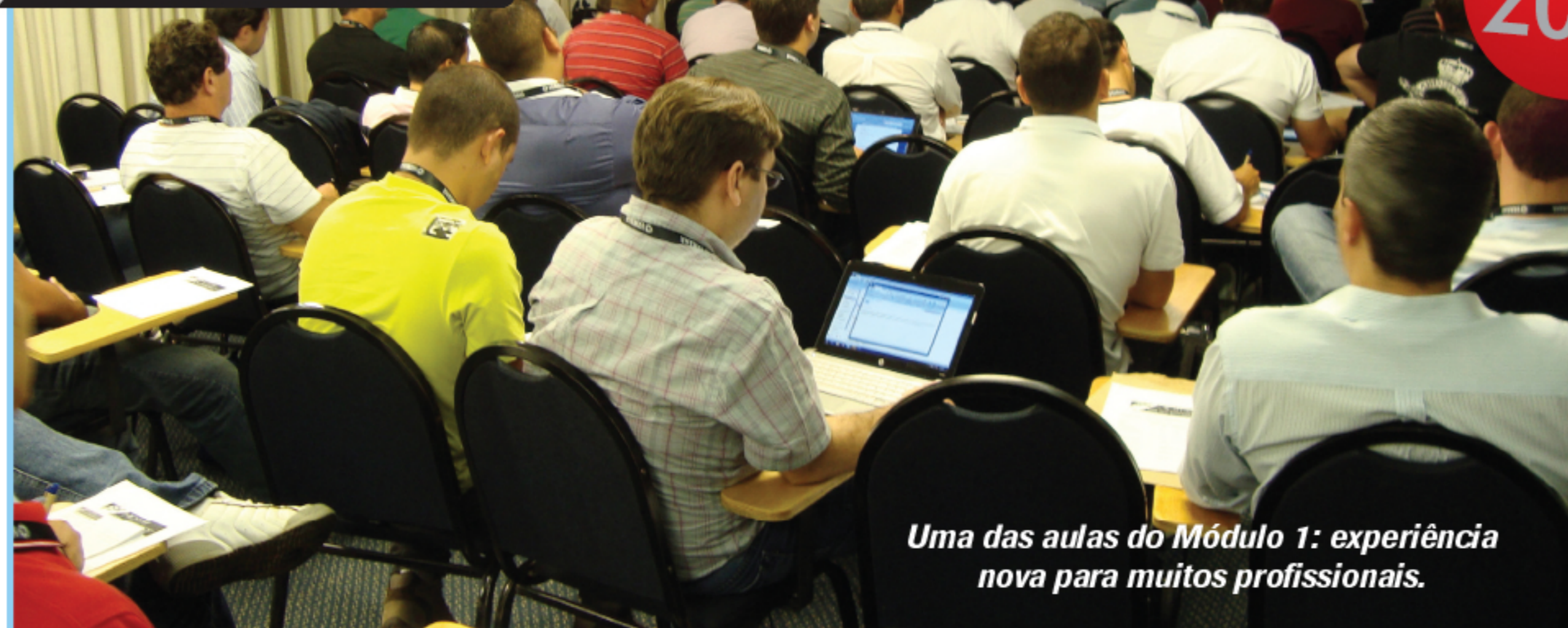
Uma das aulas do Módulo 1: experiência nova para muitos profissionais.